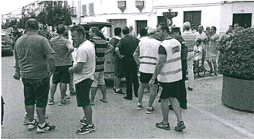
Los vecinos de Pedrera se echaron a la calle para participar en la batida de búsqueda.

Además, el suceso contó con una difusión masiva a través de las redes sociales, donde se ofrecía la foto del desaparecido así como diferentes datos que pudieran ser de utilidad para averiguar su paradero, incluidos los teléfonos de contacto de un familiar, de las fuerzas de seguridad y los servicios de emergencia. Los retuits y las publicaciones compartidas podían contarse por decenas, con el objetivo de echar